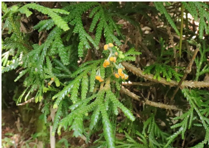
アスナロヒジキ。美味しそうな名前の菌類です。