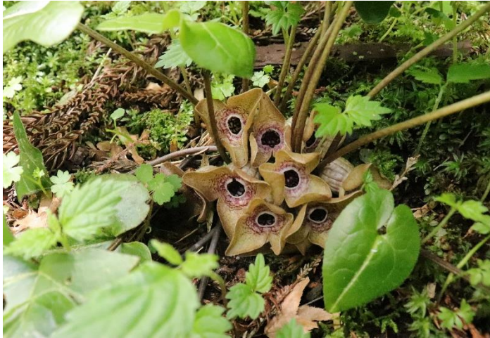
ランヨウアオイ。目玉みたいとの声が出ていました。