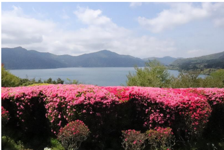
お天気が良ければ展望広場から富士山も望めます。今回は心の目で見てきました。

恩賜公園は芦ノ湖に突出していることもあって、湿度が高いこともあり、コケやシダもよく観察できます。