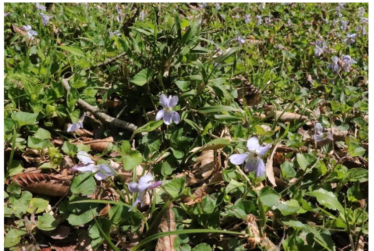
タチツボスミレのお花畑。 花が白く、距が紫色のオトメスミレもありました。