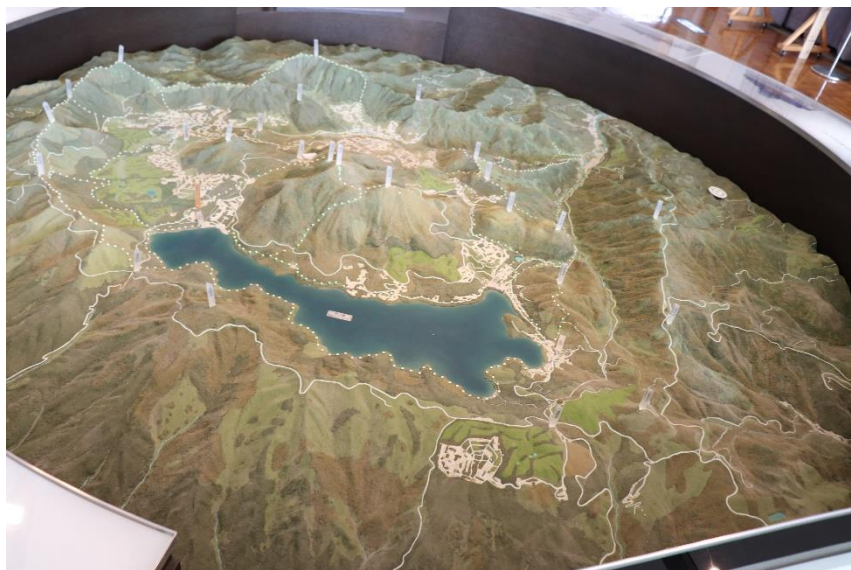
箱根立体模型（箱根VC展示物）