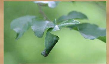
オトシブミのゆりかご