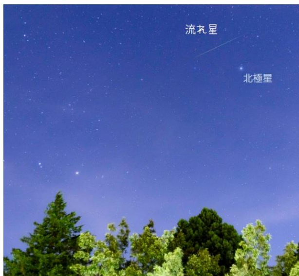
2020年8月13日 ペルセウス座流星群 箱根 小涌谷にて

流れ星は宇宙をただよう小さなチリの粒が地球の大気に飛びこんでくることで、光り輝く現象です。実は毎日流れているため晴れている日に夜空をながめてみると、流れ星を見ることが出来るかもしれません。とくに流星群の頃にはたくさんの流れ星が流れます。8月13日頃にはペルセウス座流星群がピークを迎えます。今年は月明かりの影響が少ないので、流れ星を条件良く見られるチャンスですよ。